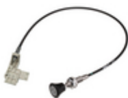
Mechanical remote control